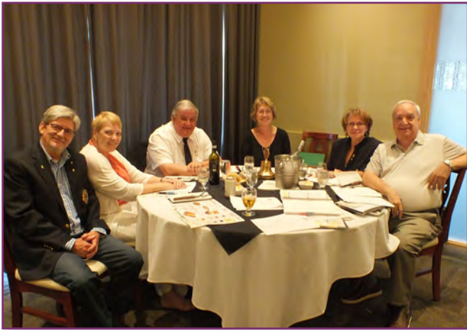
Notre table d'honneur