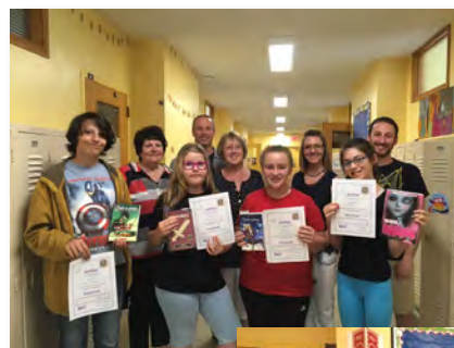
Classe de 5e