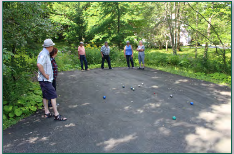
Plusieurs équipes se sont affrontées