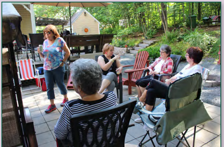
C'est le temps de se raconter nos vacances