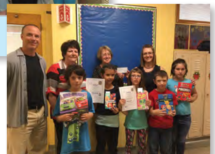
Classe de 3e