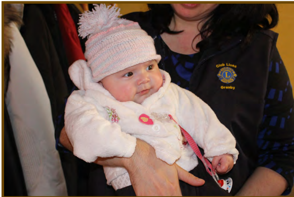
Notre plus jeune "membre" grandit de réunion en réunion