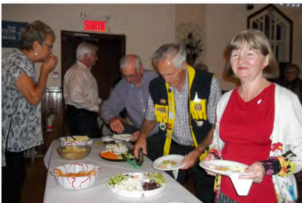
Pas de réunion de zone sans un léger goûter avant de repartir