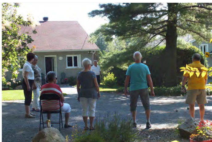
Rien de mieux qu'une bonne partie de pétanque pour s'amuser