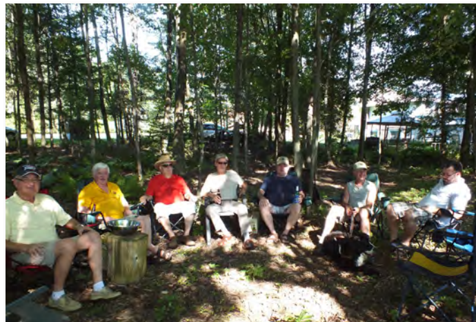
Discussions intimes entre hommes dans le sous-bois