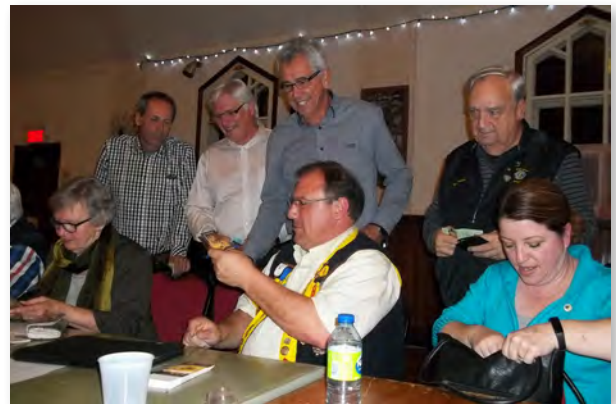
Et c'est l'affluence pour acheter ces billets