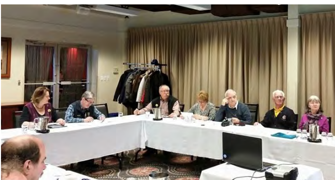
La formation des animateurs : un atelier dense et instructif, mené rondement sur le déroulement des ateliers du congrès, partie majeure d'un congrès