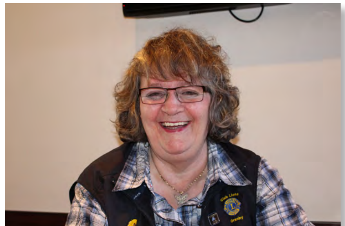
Juste parce que le lion photographe Ronald trouvait la photo bien belle