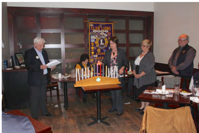
Moments solennels de la cérémonie de la lumière