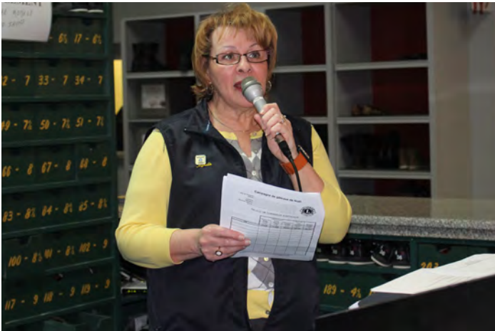
L'animation et les tirages par Lion Myreille