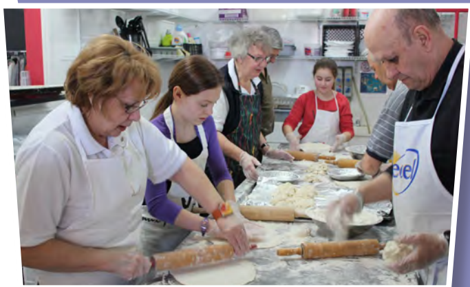
On "bénévoit" bien sérieusement et bien...serrés, certains contents de la nouvelle recette de pâte et d'autres moins?