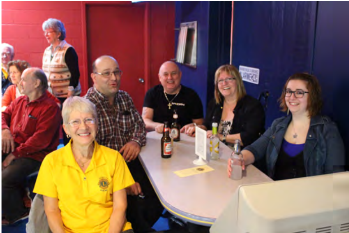
Le Club Lions d'Acton Vale était bien représenté ....