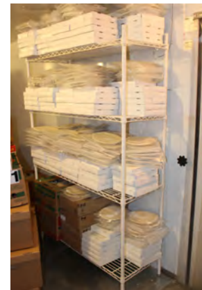
Lion Ronald tenait bon compte de toute la production et de la mise au congélateur du produit fini