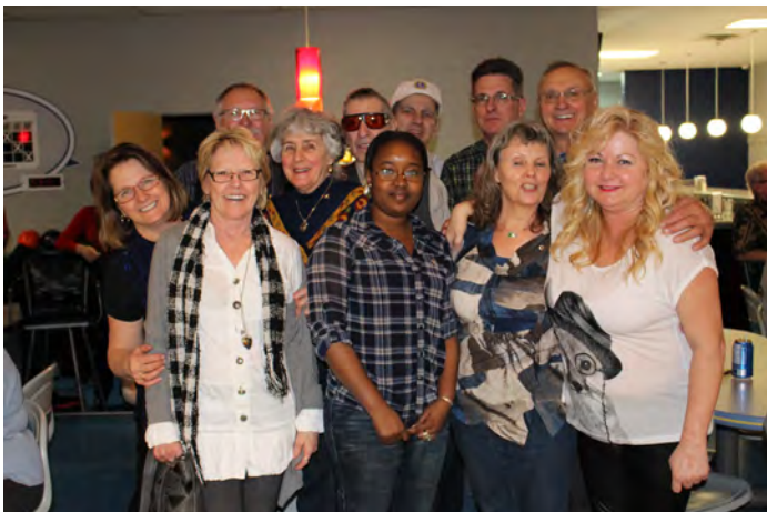
Une impressionnante délégation du club Lions de Saint-Hyacinthe par amitié pour nous