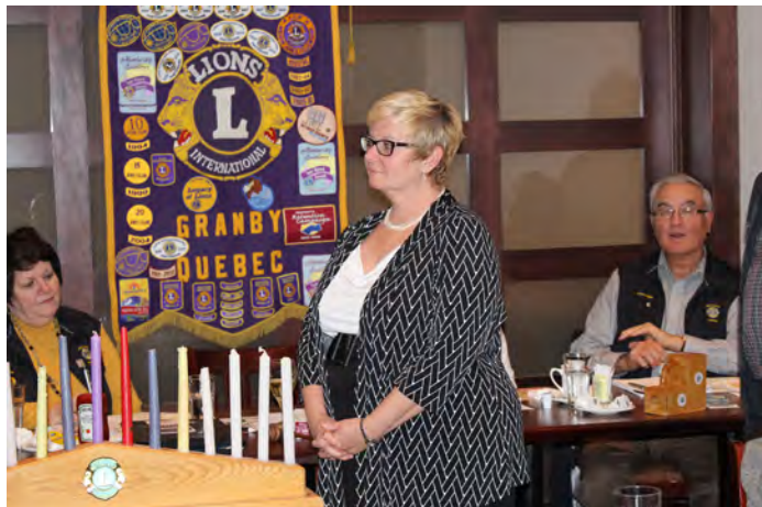
Bien attentive au déroulement de la cérémonie