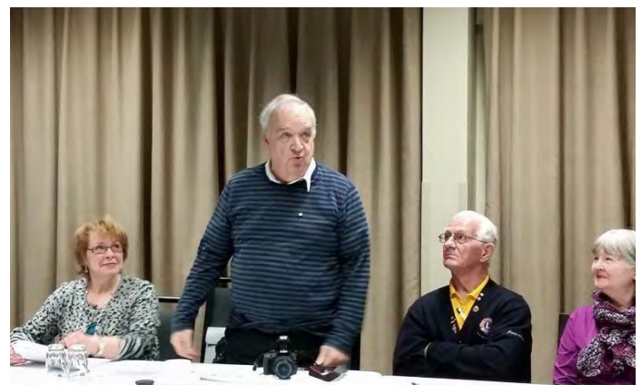
Présentation du chauffeur et accompagnateur de la co-animatrice de l'atelier de protocole