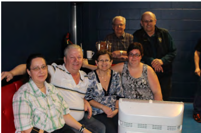
Des membres Lions de Stornoway avaient fait ce long chemin pour être avec nous. Très apprécié!