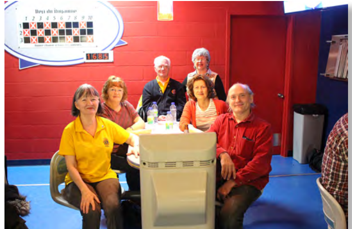
par ces 2 équipes de notre club parrain. Présents à chaque occasion.