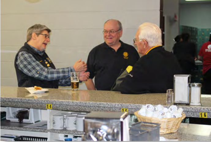
Y'en a qui jouent. D'autres jasent.