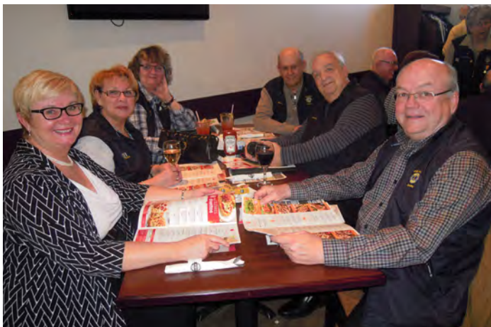
Une table bien fière de l'arrivée de Lion Hélène