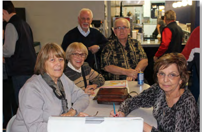
De la grande et belle visite des membres Lions de Saint-Joseph-de-Sorel. Merci!