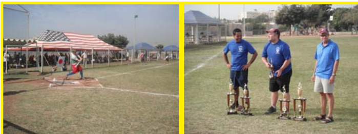
West African International Softball Tournament (WAIST) - 2012

J'ai également participé à plusieurs tournois de badminton au Cameroun ainsi qu'au Zaïre.