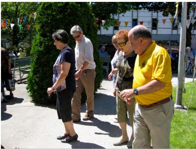
Quoi de mieux que la danse pour faire un brin d'exercice