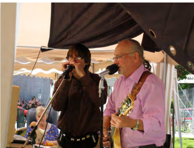
De la musique! C'est essentiel pour faire la fête!