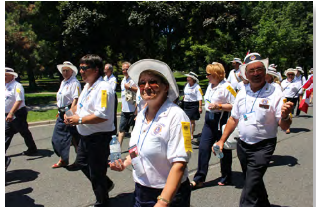
Tout le monde en place, c'est enfin notre tour de quitter le parc