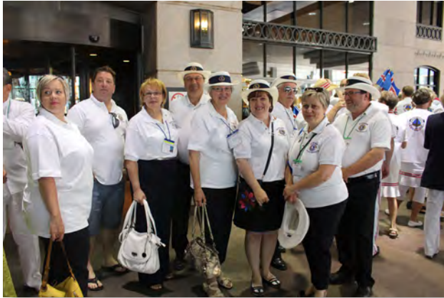
Une bonne partie de la délégation québécoise au départ de la navette