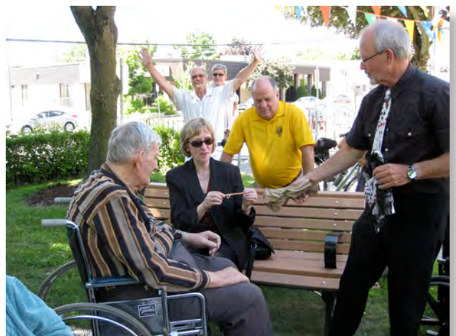
Un peu de magie pour divertir les résidents