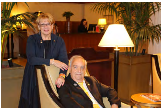
Dans le hall du Fairmont Le Reine Élisabeth à Montréal pour le diner France-Québec