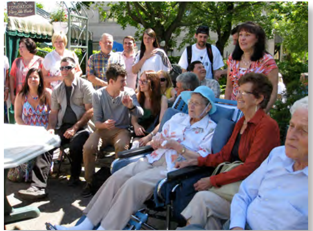
Par une aussi belle journée, plusieurs résidents et leurs familles avaient accepté notre invitation de se réunir