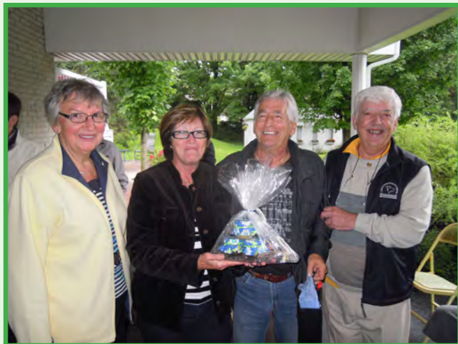
Félicitations et remerciements à nos hôtes pour cette agréable journée