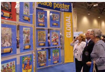
Toutes les "Affiches de la Paix" présentées à l'Internationale