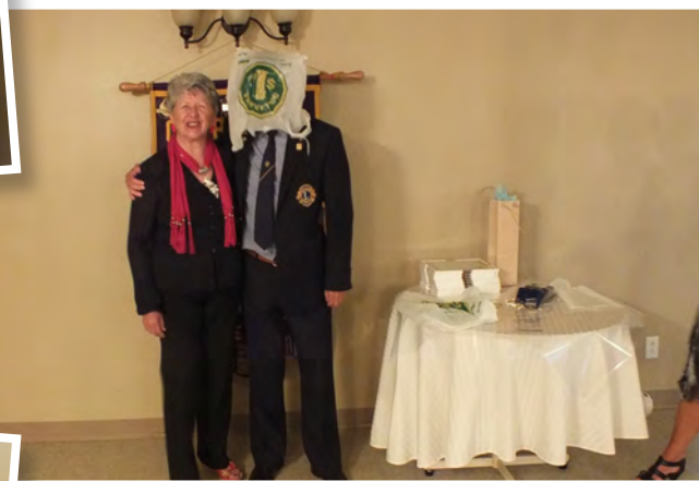
On voit où le président a acheté ses cadeaux