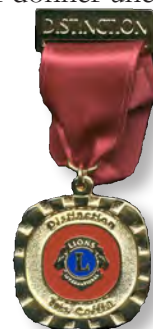
Distinction "Tris Coffin"