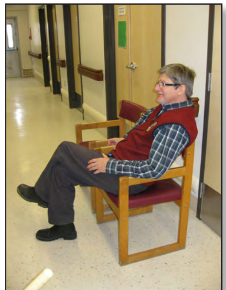
Faut bien que quelqu'un surveille...