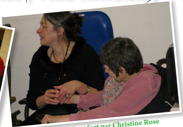
Un peu de réconfort par Christine Rose