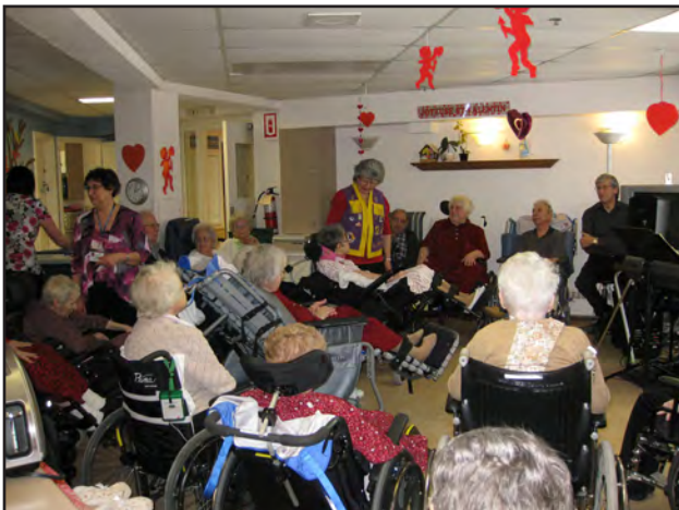
Une vue de la nombreuse participation des résidents sur un étage