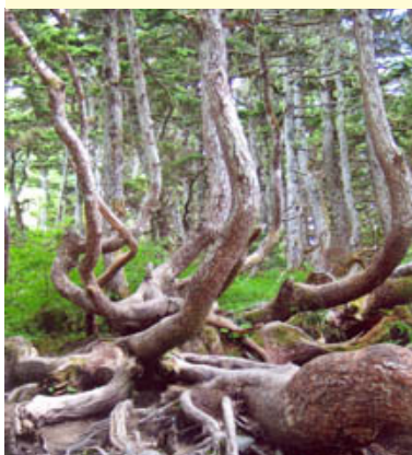
Club Lions de Coon Rapids, Minnesota