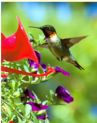
Club Lions de Orrville, Ohio