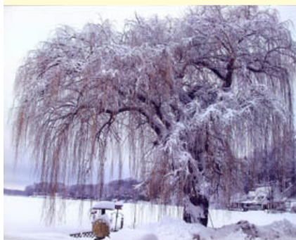
Club Lions de ELKHART COMMUNITY, Indiana