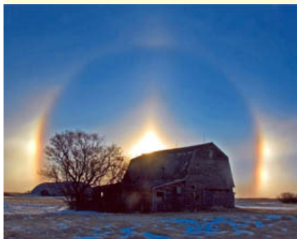
Club Lions de Noonan, Dakota du Nord