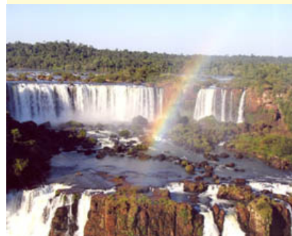
Club Lions de Northridge, Californie