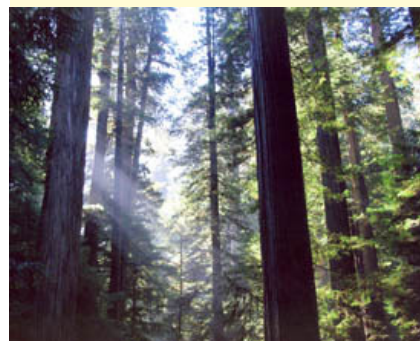
Club Lions de Boise Bench, Idaho