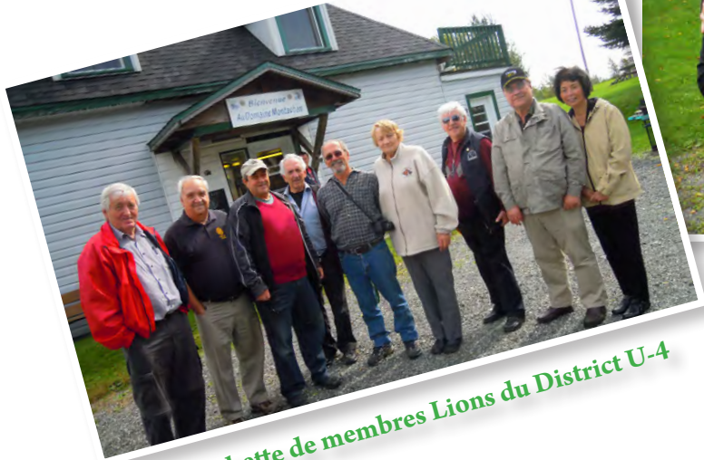
Belle brochette de membres Lions du District U-4