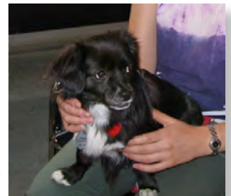
Mali bien installée

Un coup de fil à l'organisme Zoothérapie Québec mettra en œuvre le processus d'évaluation des besoins car le spectre des bénéfices de cette thérapie est large. Ils font l'évaluation pointue des lieux, des personnes et des besoins afin de jumeler les thérapeutes et les chiens les mieux adaptés à chaque situation. La brigade est constituée d'une trentaine de chiens issus d'éleveurs ou de familles et sont triés sur le volet selon certaines qualités essentielles: bon tempérament, stabilité émotionnelle, adaptables. La sécurité des interventions requiert cette sélection rigoureuse.