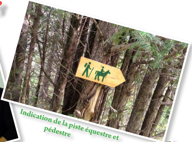
Indication de la piste équestre et pédestre