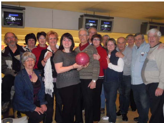
Un groupe de Lions bien joyeux