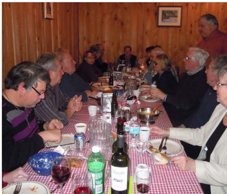
Les Clubs de Farnham, Granby, Cowansville étaient représentés