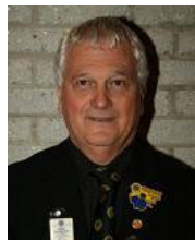
Lion Denis Rochefort Club Lions de Saint-Agapit