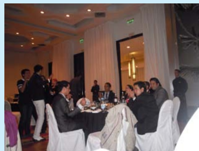
La table du Club Léos de Rabat... 18-35 ans... sur fond de musique de danse. En attendant l'entrée... qui a été servie vers 10 h 45 !!!