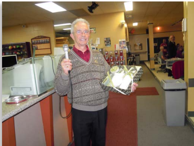
Le responsable de l'activité avec un de ses nombreux prix de tirage