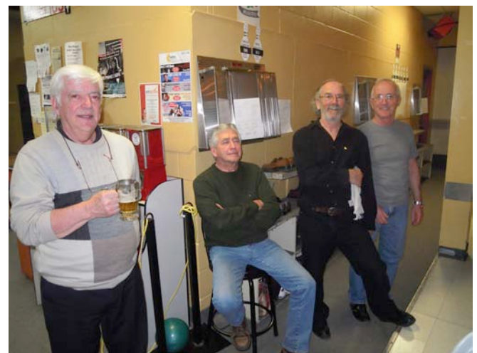
Un moment de détente pour les Lions Robert, Roger, Paul et Normand