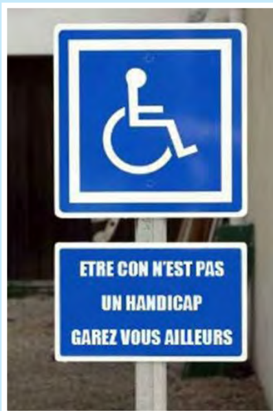
Ah ces belges, ils ont quand même le sens pratique et avec eux un chat est un chat ...