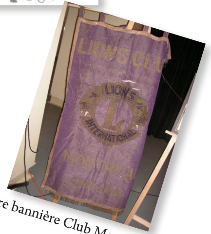
1ère bannière Club Montréal 1922