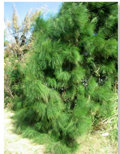
Ah mon beau ... filao

Puis, j'oubliai ceci pour reprendre mes activités professionnelles. Mais suivant les pressions de mon épouse et de quelques collègues il fallait bien penser au sapin de Noël. En Côte d'Ivoire, sapin il n'y avait pas. Il fallait se rabattre sur un autre type d'arbre que l'on fini par trouver. Il s'agissait en l'occurrence d'un « filao » une sorte de pin à très longues aiguilles. Disons que ça pouvait faire la « job ». Nous étions contents de la trouvaille. Mon épouse s'occupa de la décoration de notre arbre de Noël. Elle s'en sortit merveilleusement bien, ayant beaucoup d'expérience comme puéricultrice.