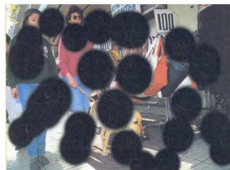
Ce que voit une personne atteinte

La rétinopathie diabétique est à l'origine d'environ 5 % des 39 millions de cas de cécité dans le monde et elle est de plus en plus souvent la cause de la diminution de l'acuité visuelle chez les adultes en âge de travailler (de 20 à 65 ans) dans les pays industrialisés. Il est impossible de redonner la vue à une personne l'ayant perdue en raison d'une rétinopathie diabétique. Les personnes qui ne font pas l'objet d'un suivi médical régulier lorsqu'ils atteignent l'âge de la retraite ou qui sont issues de minorités sont prédisposées à cette maladie.