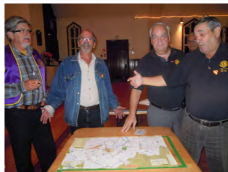
Un défi (reconstituer la carte) facilement relevé de la part des visiteurs