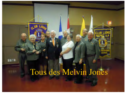
Tous des Melvin Jones