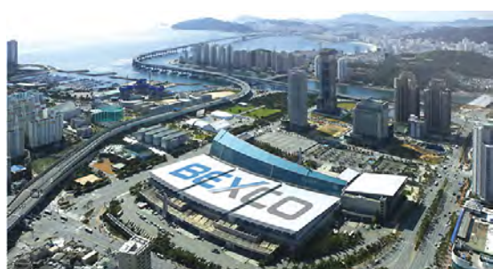
Centres des Congrès BEXCO

La convention s'ouvrira le 22 juin par le banquet de gala du séminaire des gouverneurs élus de districts. Le lendemain, l'impressionnant défilé des nations rassemblera près de 10000 Lions de plus de 120 pays, arborant pour beaucoup leur costume traditionnel qui marcheront accompagnés de chars et de fanfares. Dimanche le 24, séance plénière d'ouverture avec discours présidentiel, cérémonie des drapeaux, résultats du défilé international suivis des séminaires. Le lendemain, deuxième séance plénière, séminaires, déjeuner des Compagnons de Melvin Jones et bien plus.