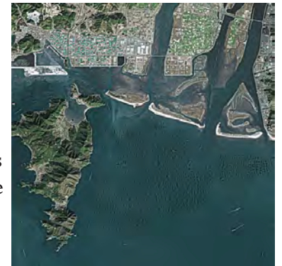
Port de Busan

de son trafic que par son efficacité. Busan est également célèbre pour ses paysages pittoresques. Cette ville maritime est très vivante et la visite de son marché aux poissons un must. L'été est une saison généralement très chaude et humide. La devise de la Corée du Sud est le won (KRW). La valeur d'un won correspond à quelques fractions d'un euro.