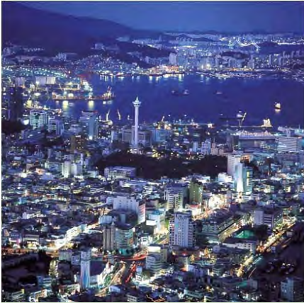
Ville de Busan la nuit

Située dans un paysage exceptionnel composé de montagnes bleues, de rivières et de longues plages, et illuminé de nuit par les éclairages au néon du pont de diamant, Busan compte parmi les plus belles villes du monde. La douceur de la température, la culture coréenne unique, ainsi que la cuisine locale dominée par les fruits de mer frais et, en particulier, le kimchi, plat traditionnel coréen sont à apprécier.