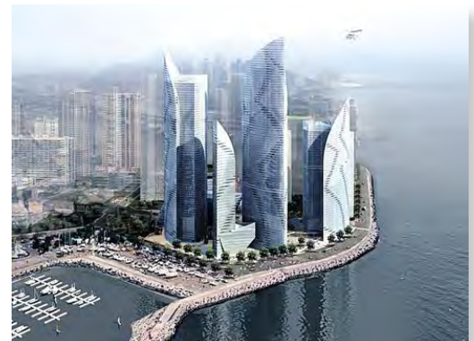
Le futur de Busan

comme le plus important festival international du film en Asie. Engagé en faveur du nouveau cinéma et du cinéma d'auteur, il demeure aussi l'un des plus gros marchés du film. En quelques décennies, la Corée du Sud est passée de pays du tiers-monde au rang de pays fortement industrialisé.