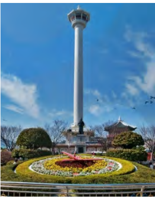
La Tour de Busan

Une part relativement importante de la population de Busan est d'origine russe et un quartier connu sous le nom de « rue des magasins étrangers » compte de nombreux commerces russes. Le secteur a été appelé d'abord « rue des Étrangers » parce que beaucoup d'entreprises s'y sont installées pendant les années 1940 et 1950 pour approvisionner les troupes américaines dans le secteur.