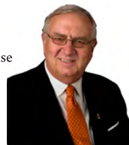
Lion Wayne Madden

Enfin, le mardi 26 juin, lors de la séance plénière de clôture, il y aura installation du président international de 2012-2013, Lion Wayne Madden, de l'Indiana, remise du drapeau de l'ONU, remise du prix humanitaire et intronisation des 745 gouverneurs de districts 2012-2013 des 206 pays représentés à l'Association internationale. Tous ces élus entreront en fonction le 1er juillet 2012.