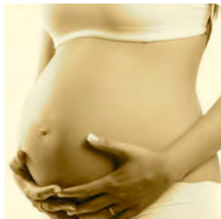
Hors-concours (trop jeune)