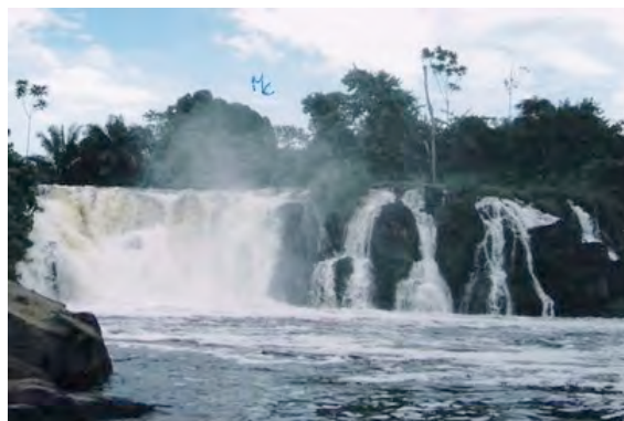
Chutes de la Lobé près de Kribi

Un ami Lion, architecte de sa profession, y avait construit un petit hôtel et j'aimais bien m'y rendre. Un jour que je me promenais dans le village, je remarquai un curieux personnage, un homme d'un âge certain, qui se promenait avec un énorme barracuda sur la tête. Au départ, je vous dis que ça surprend. Puis une idée me vient. Je lui demande ce qu'il va faire avec son poisson.