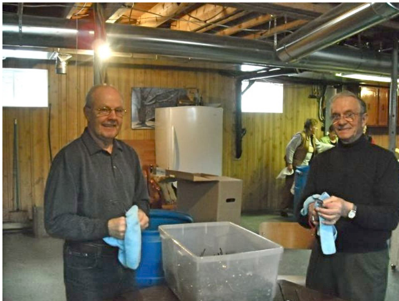
Ces lunettes qui ne servent plus ici redonneront prochainement une meilleure vue aux gens dans le besoin aux Philippines.

membre du Club de Coaticook. Ce dernier ne saurait si bien dire puisque selon Optométristes Sans Frontières, organisme basé à La Prairie, « on estime à huit millions le nombre de personnes dans le monde qui sont non voyantes à cause d'erreurs de réfraction non corrigées ».