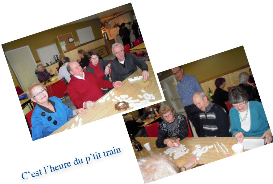
C'est l'heure du p'tit train