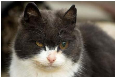
Un chat portant une prothèse oculaire

Les verriers de ce coin de pays développèrent en 1868 un mélange contenant un minerai qui permettait la fabrication de prothèses très résistantes à la corrosion (deux à trois ans) et un effet très naturel. Ce verre est toujours le même de nos jours et sa recette est jalousement gardée par deux verreries d'Allemagne.