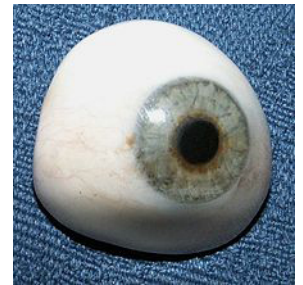
Une prothèse oculaire pour l'œil droit

Au XVIIIe siècle, ce sont les prothèses françaises les plus recherchées. Elles se présentent comme des demi-coquilles découpées et prennent ainsi mieux la forme de la cavité qui n'est jamais totalement sphérique. Cependant, ayant toujours la même épaisseur, elles ne sont pas toujours très esthétiques. Vers 1835, un souffleur de verre d'Allemagne s'intéresse aux prothèses et très vite, celles qu'il fabrique surpassent en qualité la production française. Mais le verre alors utilisé contenait du plomb provoquant des irritations et se dégradant rapidement. Il fallait changer les prothèses tous les six mois.