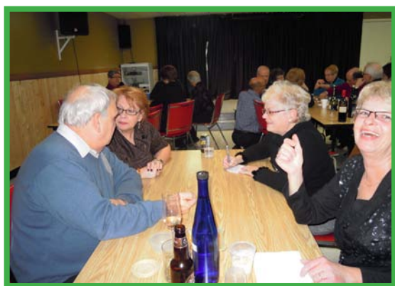
... des dés