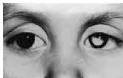
Enfant atteint de rétinoblastome: signe de la pupille blanche

Les signes qui doivent alerter les parents sont en particulier une coloration blanche de la pupille (qui est normalement noire) ou un strabisme (déviation d'un œil). La tumeur est visible par l'ophtalmologiste lorsqu'il examine le fond de l'œil. La surveillance est primordiale pour détecter l'atteinte de l'autre œil.