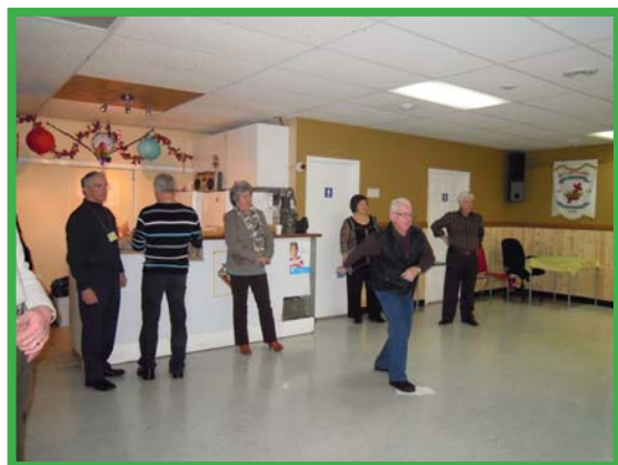
et du baseball - poches