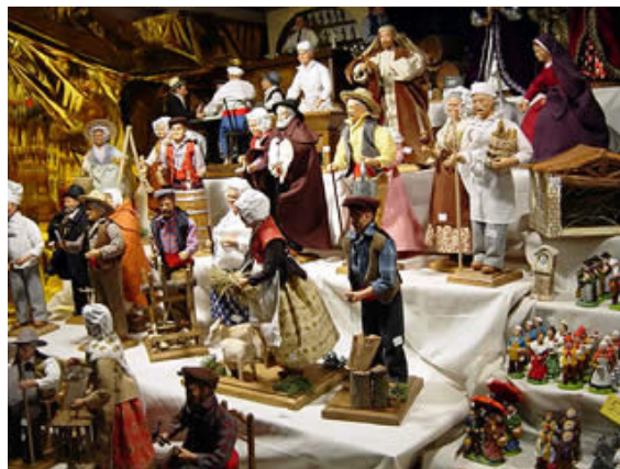
Santons de Provence

En Provence, on rencontre un succès important avec la vente des fameux santons. Les santons de Provence sont de petites figurines en argile très colorées, représentant, dans la crèche de Noël la scène de la nativité (l'enfant Jésus, la Vierge Marie et Saint Joseph, avec l'âne et le bœuf, les Rois Mages et les bergers ainsi que toute une série de petits personnages figurant les habitants d'un village provençal et leurs métiers traditionnels. À Marseille, la foire aux santons (datant de la fin du XIXe siècle) est ouverte dès la fin du mois de novembre, et jusqu'au 31 décembre. Les premiers santons étaient confectionnés en mie de pain, mais petit à petit c'est l'argile rouge de Provence qui a été privilégiée pour la fabrication. Si les santons sont longtemps restés de fragiles créations en argile crue, la cuisson de l'argile s'est imposée un peu partout de nos jours. C'est un marseillais qui, aux alentours de 1800, fut le premier fabricant connu de santons. Depuis, le métier de santonnier s'est ajouté aux métiers traditionnels de la Provence.