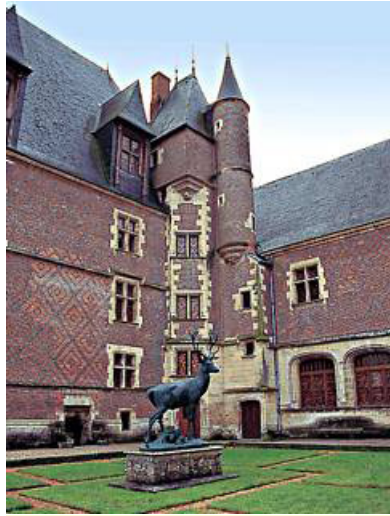
Musée international de la Chasse - Château de Gien