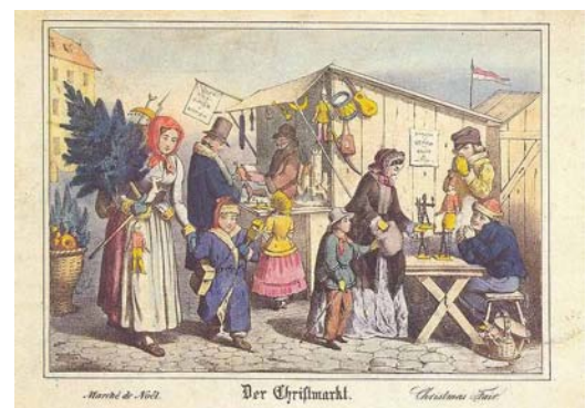
Marché de Noël à Nuremberg au XIX e siècle

Un important renouveau, considéré comme commercial a eu lieu au milieu des années 1990. De nombreuses villes et villages en Europe ont instauré leur propre marché de Noël avec des chalets et parfois des attractions comme une patinoire, une grande roue et ce dans tous les pays du continent.