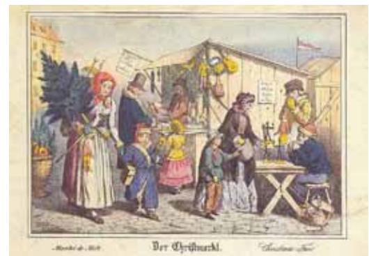
Marché de Noël à Nuremberg au XIX e siècle

Un important renouveau, considéré comme commercial a eu lieu au milieu des années 1990. De nombreuses villes et villages en Europe ont instauré leur propre marché de Noël avec des chalets et parfois des attractions comme une patinoire, une grande roue et ce dans tous les pays du continent.