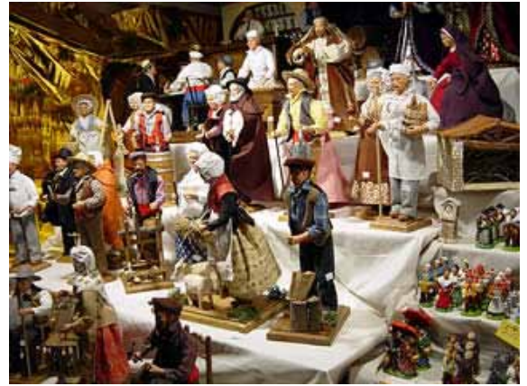
Santons de Provence

En Provence, on rencontre un succès important avec la vente des fameux santons. Les santons de Provence sont de petites figurines en argile très colorées, représentant, dans la crèche de Noël la scène de la nativité (l'enfant Jésus, la Vierge Marie et Saint Joseph, avec l'âne et le bœuf, les Rois Mages et les bergers ainsi que toute une série de petits personnages figurant les habitants d'un village provençal et leurs métiers traditionnels. À Marseille, la foire aux santons (datant de la fin du XIXe siècle) est ouverte dès la fin du mois de novembre, et jusqu'au 31 décembre. Les premiers santons étaient confectionnés en mie de pain, mais petit à petit c'est l'argile rouge de Provence qui a été privilégiée pour la fabrication. Si les santons sont longtemps restés de fragiles créations en argile crue, la cuisson de l'argile s'est imposée un peu partout de nos jours. C'est un marseillais qui, aux alentours de 1800, fut le premier fabricant connu de santons. Depuis, le métier de santonnier s'est ajouté aux métiers traditionnels de la Provence.