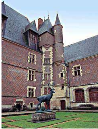
Musée international de la Chasse - Château de Gien