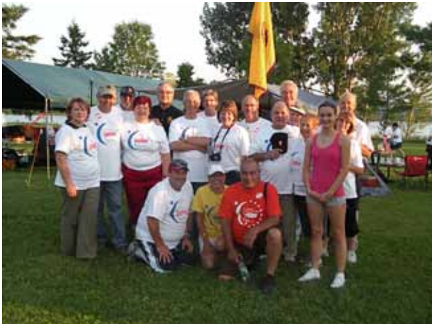
L'équipe Lions 2010

Il existe 82 Relais répartis partout au Québec. Les fonds amassés lors du Relais pour la vie permettent de soutenir la mission de la Société Canadienne du cancer: l'éradication du cancer et l'amélioration de la qualité de vie des personnes touchées par le cancer.